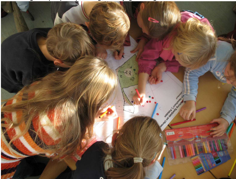
Abbildung 3: Spielplatzplanung, Stadtjugendring Potsdam e.V.

Finanzbedarf / Kosten / Jahr: im Rahmen des Verwaltungshandelns möglich