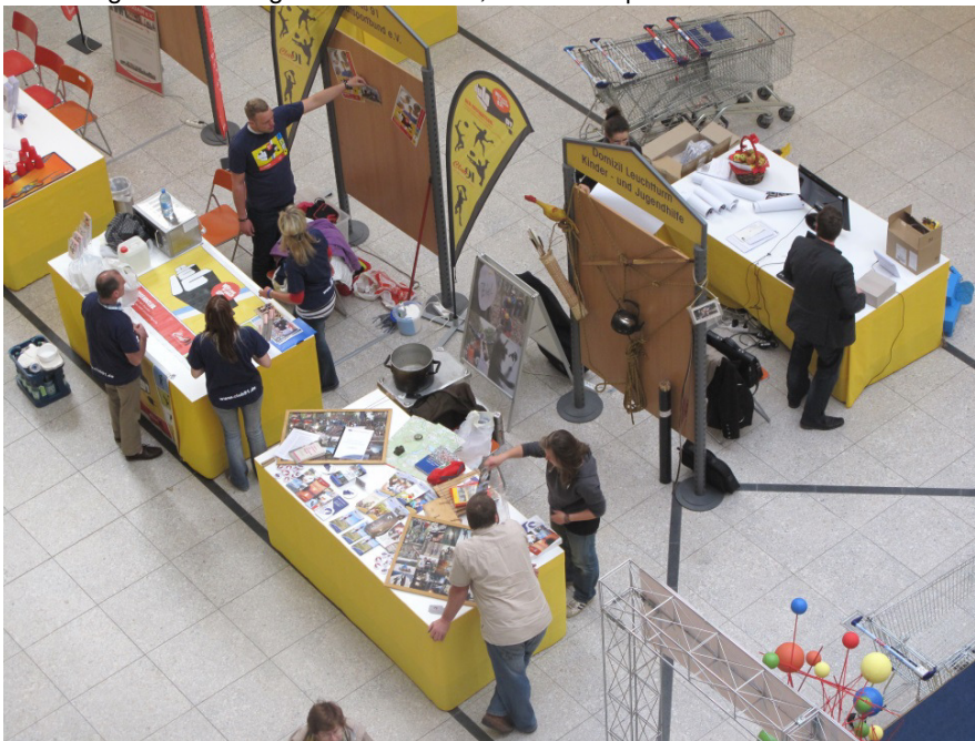
Abbildung 7: Aktionstag im Stern-Center, Landeshauptstadt Potsdam / B. Ukrow

Finanzbedarf / Kosten / Jahr: im Rahmen des Verwaltungshandelns möglich