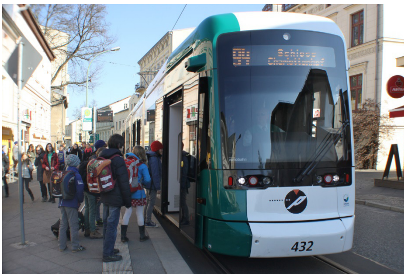
Abbildung 6: ÖPNV in Potsdam, Landeshauptstadt / F. Daenzer

Finanzbedarf / Kosten: im Rahmen von Planungskosten und Prioritätenliste zu ermitteln