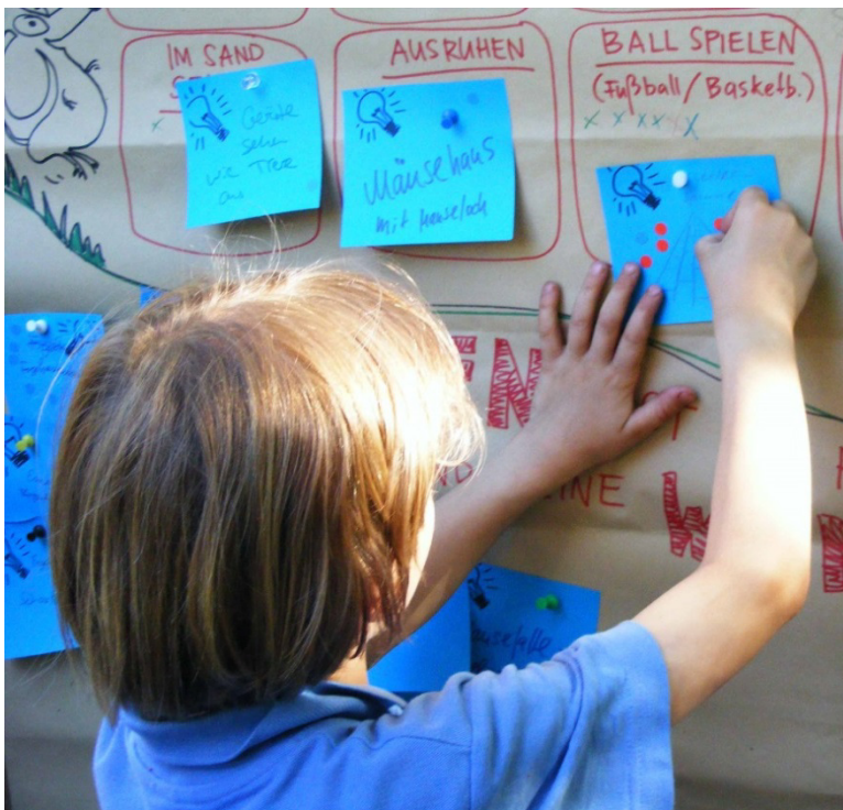
Abbildung 5: Spielplatzplanung, Stadtjugendring Potsdam e.V.

Finanzbedarf / Kosten / Jahr: im Rahmen der finanzierten Tätigkeit möglich