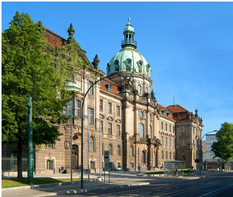
Abbildung 1: Rathaus, Landeshauptstadt Potsdam / M. Lüder

Mit der Verleihung des Siegels beginnt dann der sechste und letzte Schritt: In den kommenden zwei Jahren sollen mit der schrittweise Umsetzung der im Aktionsplan festgelegten Maßnahmen zur Verbesserung der Kinder- und Jugendfreundlichkeit in Potsdam begonnen werden. Als kinderfreundliche Stadt ist die Landeshauptstadt bereits sehr gut aufgestellt und kann mit diesem Prozess die Kinder- und Jugendfreundlichkeit in Potsdam noch weiter qualifizieren.