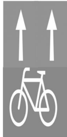
b) Piktogramm Einrichtungsradschw