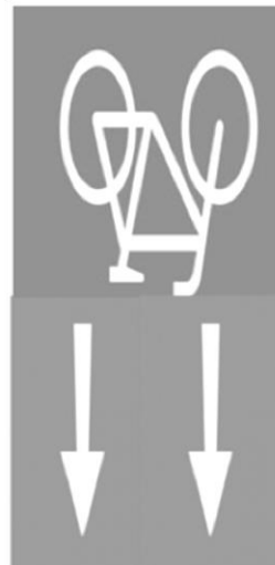
d) Piktogramm nach Ende Zweirichtungsradweg auf Einrichtungsradschw