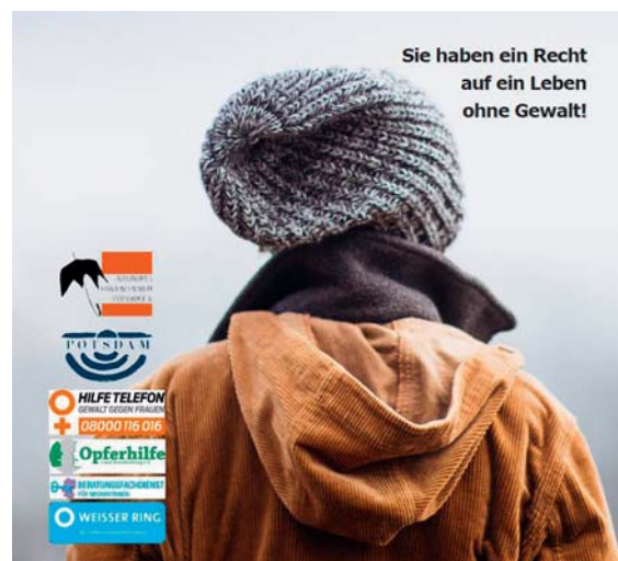
Flyer „Häusliche Gewalt“, 2015

Die Beauftragte für Migration und Integration ist auch Mitglied in diesem AK und wirkt mit.