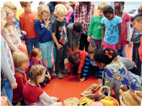
Wie leben Kinder in Togo? - eine Veranstaltung des Vereins Bildung für Balanka e. V.

Das Programm für Potsdam wird durch das Büro für Chancengleichheit und Vielfalt koordiniert, gestaltet und veröffentlicht. So werden Jahr für Jahr wichtige Impulse über Migration und Integration in die öffentliche Diskussion eingebracht. Ein Ziel der Aktionswoche ist das Eintreten für bessere politische und rechtliche Rahmenbedingungen des Zusammenlebens von Deutschen und Zugewanderten.