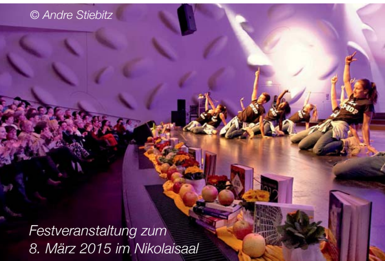
Festveranstaltung zum 8. März 2015 im Nikolaisaal

2015 stand die Brandenburgische Frauenwoche unter dem Motto „25 Jahre Frauen- und Gleichstellungspolitik in Brandenburg – Weite Wege zur Gerechtigkeit“ und 2016 lief sie unter der Überschrift „Frauengenerationen im Wechselspiel – Chancen, Risiken und Nebenwirkungen“ und thematisierte den anstehenden Generationenwechsel in Brandenburgs Frauenvereinen und -verbänden.