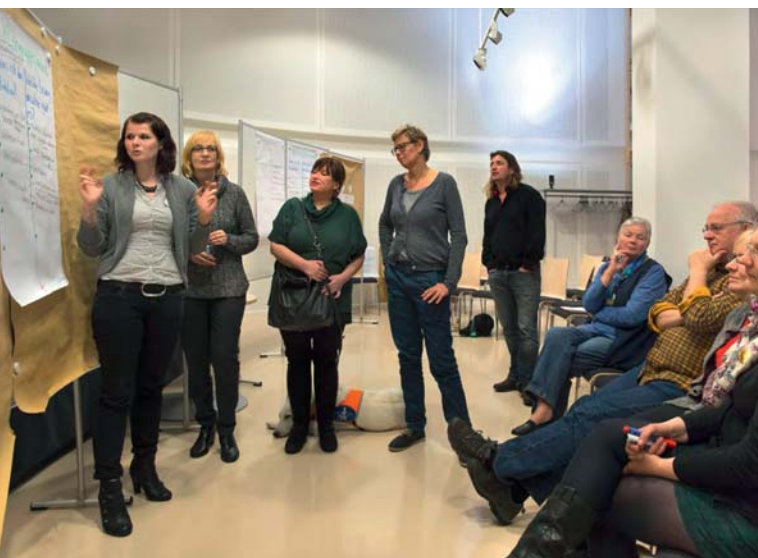
Macht mit! - Ideenwerkstatt Chancengleichheit, 2015