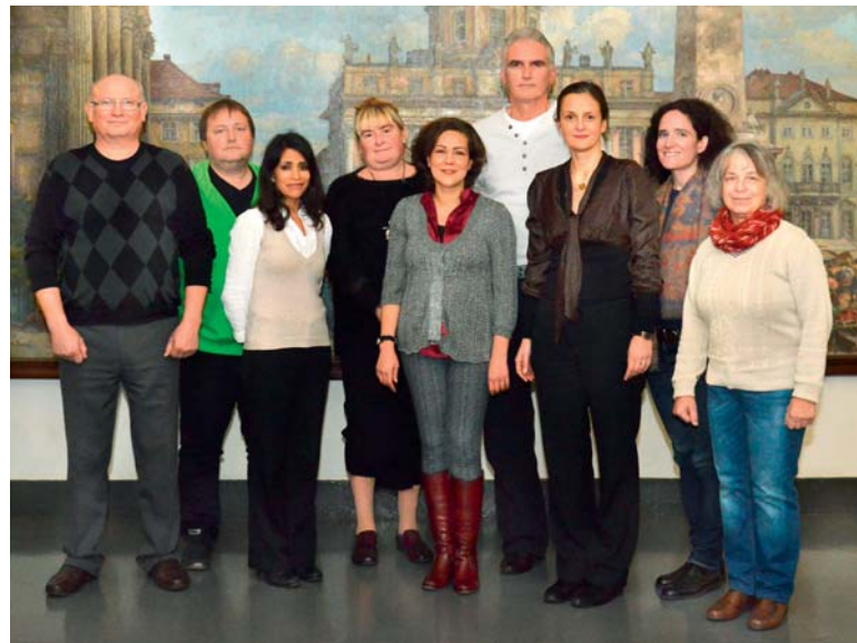
Migrantenbeirat der Landeshauptstadt Potsdam

Der Migrantenbeirat ist ein beratendes Gremium der Stadtverordnetenversammlung und ihrer Ausschüsse. Die neun ehrenamtlichen Mitglieder des Migrantenbeirates vertreten dort die Interessen der Potsdamer Bürgerinnen und Bürger mit ausländischem Pass. Die Arbeit des Migrantenbeirates fördert einen gelingenden Integrationsprozess in der Landeshauptstadt Potsdam. Der Migrantenbeirat hat mit der Initiierung der jährlichen Auslobung des Integrationspreises der Landeshauptstadt Potsdam erreicht, dass gute Beispiele der Potsdamer Integrationsarbeit Jahr für Jahr eine öffentliche Aufmerksamkeit bekommen. Die Beauftragte für Migration und Integration ist mit dem Potsdamer Migrantenbeirat intensiv vernetzt, tauscht Informationen mit ihm aus und organisiert gemeinsame Veranstaltungen.