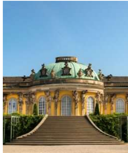
Abbildung 4: Schloss Sanssouci, frontale Ansicht, mit oberster Terrasse.

Das UNESCO-Welterbe spiegelt die Bedeutung Potsdams für die Zeitgeschichte wider und zeugt von den großen Ideen seiner Bauherren. Dieser architektonische Reichtum lässt Besucher immer wieder aufs Neue staunen und innehalten. Potsdam ist heute eine grüne Insel mit mediterranem Flair, inmitten einer einzigartigen Kulturlandschaft am Wasser. Es ist etwas Besonderes, hier zu leben. Irgendwie feinsinnig, entspannt und erlesen. Genau dieses Potsdam-Gefühl gilt es unseren Gästen zu vermitteln. Mit viel Herz. Weitblick und Mut.