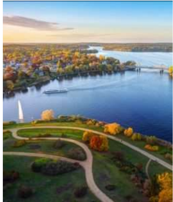
Abbildung 2: Potsdamer Kulturlandschaft am Wasser.