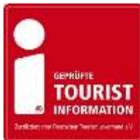
Abbildung 5: DTV Auszeichnung "i-Marke".

Als Mitglied des Deutschen Tourismus Verbands e.V. (DTV) sind die Tourist Informationen der PMSG vom DTV mit der „ i-Marke “ geprüft und ausgezeichnet worden 8 . Diese Auszeichnung berechtigt dazu, mit dem vom DTV markenrechtlich geschützten weißen „i“ auf rotem Grund zu werben. Eine erneute Überprüfung der Mindestkriterien und eine Grundprüfung finden im August 2019 statt.