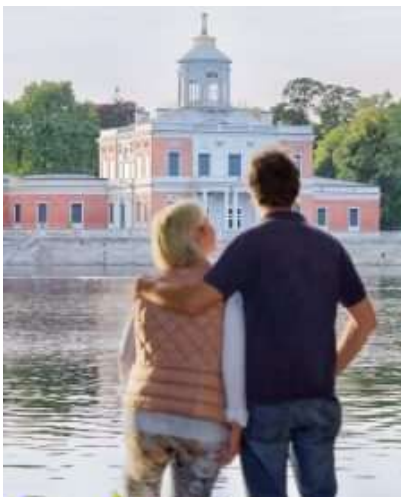
Abbildung 3: Blick auf das Marmorpalais vom Ufer des Heiligen Sees.

Die „Core Story“ der Tourismusmarke Potsdam.