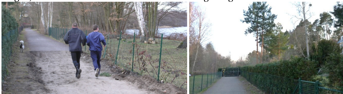
Im März 2010 liefen die beiden Jogger noch über den Kolonnenweg – wenig später war der Durchgang hier versperrt. Die Einigung über das Wegerecht schafft die Voraussetzung, das Problem hier zu lösen.

Nach den Erfahrungen der letzten Jahre ist dies eine erfreuliche und für viele sicher unerwartete Lösung des Uferwegproblems an einem Punkt, an dem zuvor die Fronten festgefahren waren. Nicht zuletzt entspricht hier das Vorgehen der Stadt den Beschlüssen des Ortsbeirates, der mehrfach gefordert hatte, einvernehmliche Lösungen anzustreben, wo immer dies möglich ist. Wann die praktischen Fragen gelöst sind, um die Wegesperre zu beseitigen, konnte ich bisher noch nicht in Erfahrung bringen.