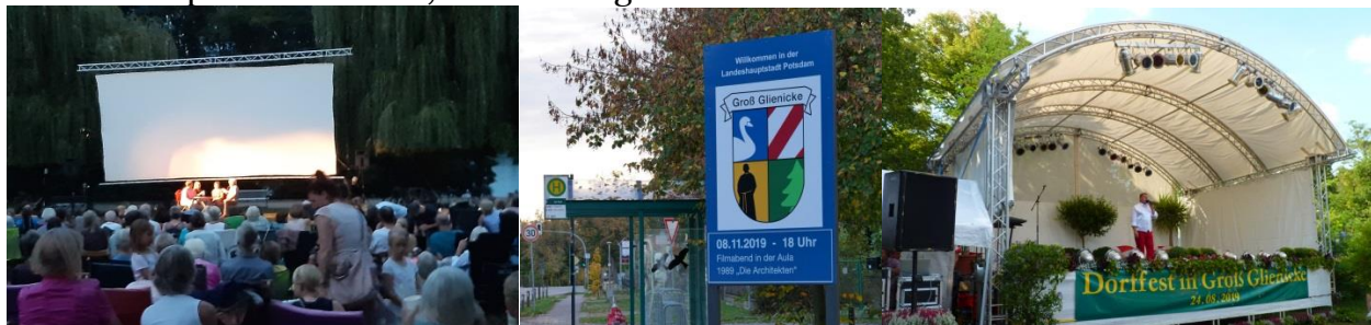
Kino auf der Badewiese, Ortseingangstafel mit Wappen, Dorffest: Mit den Fördermitteln haben wir in Groß Glienicke viel für unser Ortsteil-Leben tun können.

Für uns bedeutet die Neuregelung: Bis 2019 betrug die jährliche Summe für Groß Glienicke 17.746 Euro. Ab 2020 liegt die Summe bei etwa 20.800 Euro (ganz genau steht sie noch nicht fest). Das heißt: Wir haben mehr Möglichkeiten, unsere Ortsteilkultur zu pflegen und zu fördern. Das ist mehr wert, als manchem vielleicht bewusst ist. Denn die Möglichkeit, dass der Ortsbeirat im eigenen Ortsteil Projekte fördern kann, ohne in der Stadt darum kämpfen zu müssen, ist ein riesiger Vorteil.