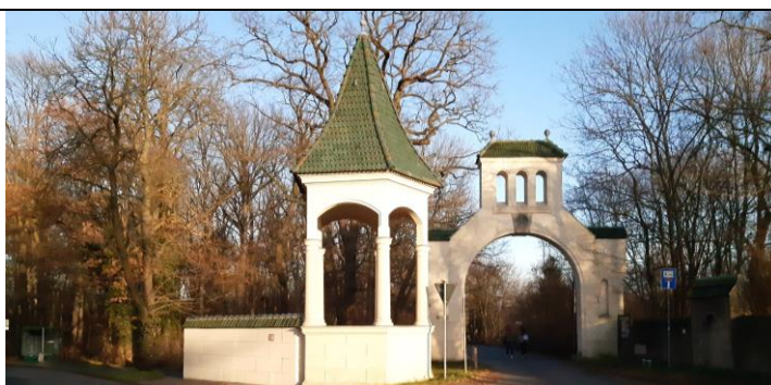
Die linke Seite des Potsdamer Tor-Ensembles ist fertig: Noch vor Jahresende ist das letzte Mauerstück gestrichen worden. Dank an Fa. Roland Schulze! Jetzt steht noch die Sanierung der Mauer rechts an.