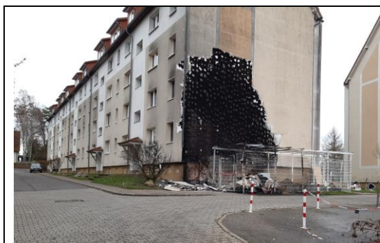
Gefährliche Silvesterknallerei: An der Ecke Ulrich-Steinhauer-Strasse fing eine Hausfassade Feuer. Zum Glück ist nicht noch mehr passiert.

Die Turnhallensanierung konnte Ende 2019 endlich abgeschlossen werden! Sein traditionelles Badminton-Turnier hat der SC 2000 wieder in der großen Sporthalle an der Schule durchgeführt. Die Regenentwässerung muss allerdings noch verbessert werden, damit die Halle bei Starkregen nicht noch einmal überschwemmt wird.