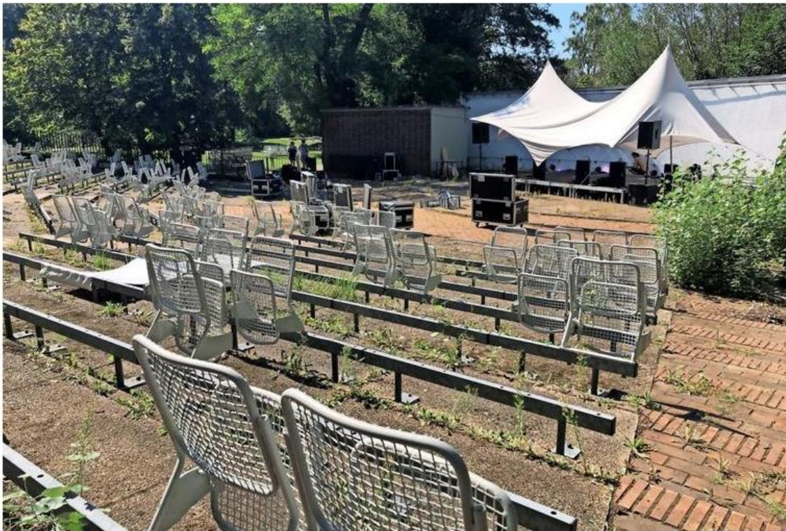
Beim Localize-Festival im August 2019 wurden einige der weißen Stühle noch einmal angeschraubt.