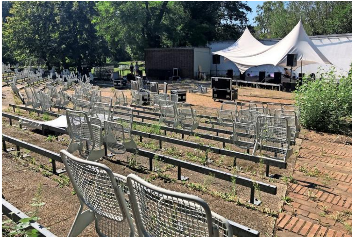
Beim Localize-Festival im August 2019 wurden einige der weißen Stühle noch einmal angeschraubt.