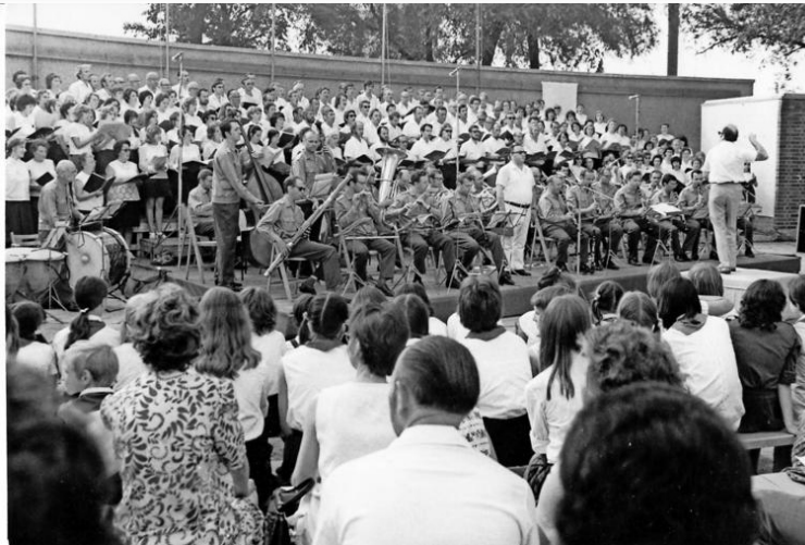
Kurz vor den Weltfestspielen der Jugend im Sommer 1973 probten Chorsänger für ein „Fest des Liedes“ auf der neuen Bühne.

https://www.maz-online.de/Lokales/Potsdam/Buehne-auf-der-Freundschaftsinsel-wird-abgerissen