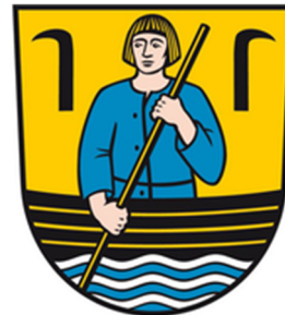
Abbildung 6: Wappen Uetz-Paaren