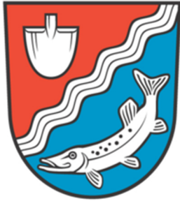
Abbildung 1: Wappen Grube