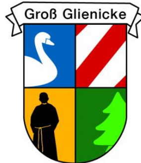
Abbildung 2: Wappen Groß Glienicke