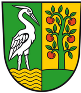
Abbildung 3: Wappen Marquardt