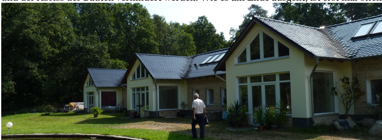
Künftig Teil des Bebauungsplans 19? Die Hofanlage im Eichengrund

Sehr zäh geht es beim Bebauungsplan 19 (Sport und Gewerbe westlich der L 20) voran. Das liegt insbesondere daran, dass dieser B-Plan zur Lösung des Problems Kinderbauernhof/ Hofanlage im Eichengrund beitragen soll. Die Anlage war ohne die notwendigen Baugenehmigungen ausgebaut worden, und die Stadt hatte dem Eigentümer mit einer Abrissverfügung gedroht. Nun hat die Stadtverordnetenversammlung gefordert, dass das Gelände in den B-Plan 19 einbezogen wird. Dadurch könnten bestimmte Nutzungen ermöglicht und der Abriss der Bauten verhindert werden. Wie es am Ende ausgeht, ist erst mal offen.