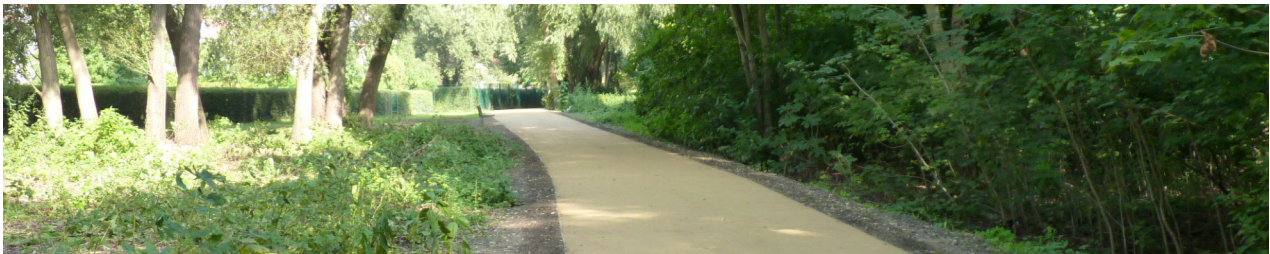
So soll der Uferweg aussehen: 2013 ausgebautes Teilstück zwischen Kirche und Begegnungshaus

Für die Öffentlichkeit ist es nicht ganz leicht nachzuverfolgen, wie der Stand der Uferwegsicherung ist. Der Abschnitt zwischen Kirche und Begegnungshaus ist fertig: rechtlich gesichert inklusive Uferfläche und fertig ausgebaut. Was hat sich außerdem getan? Seit dem Auftakt der Enteignungsverfahren durch die Landesbehörde 2013 sind eine ganze Reihe von Teilabschnitten des Weges inzwischen öffentlich gesichert worden – zum Teil durch die Anmeldung von Vorkaufsrechten seitens der Stadt, bei denen es in der Regel zu gütlichen Einigungen über das Wegerecht kam, zum Teil durch Uferkäufe von der bundeseigenen Bima, oder auch durch Gerichtsentscheidung.