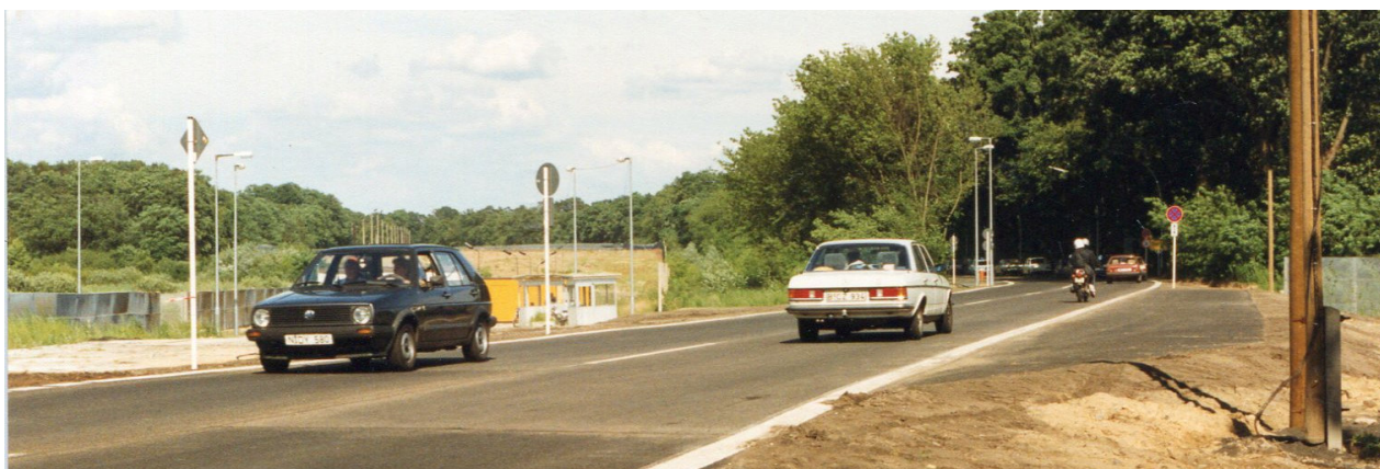
Ein Foto der damaligen Ortschronistin Annelies Laude aus dem Jahr nach dem Mauerfall: Im Sommer 1990 war die Freude groß, als Mauer und Stacheldraht beseitigt waren und der Verkehr wieder über die B 2 rollen konnte. Heute ist die Ecke Ritterfelddamm ein Knotenpunkt, an dem der Verkehr in Stoßzeiten längst nicht mehr rollt.

Der Bezirk Spandau bereitet zurzeit die Straßenausbauplanung für den Ritterfelddamm vom Selbitzer Weg bis zum Knotenpunkt Ritterfelddamm/ B 2 vor: das hat die Berliner Verkehrsverwaltung einem Bewohner der Waldsiedlung im Dezember letzten Jahres mitgeteilt. Das heißt: Für die grenzüberschreitende Abstimmung wäre es an der Zeit, dass sich Spandau und Potsdam – unter Einbeziehung unseres Ortsbeirates - in fortlaufenden Beratungen koordinieren, um das Projekt zu beschleunigen. Schließlich muss die Lösung dieses Verkehrsproblems auch als verkehrspolitischer Teil des Siedlungsbaus in Krampnitz angesehen werden.