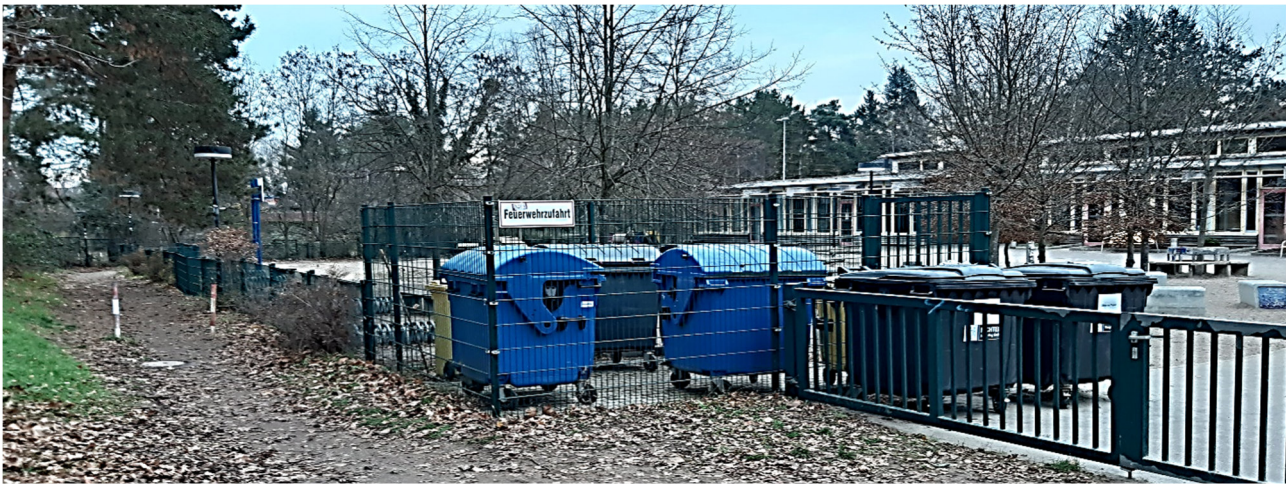
Der Fußweg führt entlang des Schulhofs zum Sportplatz.

Hintergrund der beabsichtigten Absperrung sind Sicherheitsbedenken, Kosten für die Unterhaltung des Weges und eine Flächenreservierung für eine mögliche Schulerweiterung. In seinem Schreiben an den Ortsvorsteher weist der KIS darauf hin, dass dieser Durchgang zum Sportplatz nicht öffentlich gewidmet ist und für das Erreichen des Sportplatzes auch nicht nötig sei. Tatsächlich gibt es in Höhe der St. Anna-Straße den gepflasterten Verbindungsweg, der auch zum Eingang der Sporthalle führt.