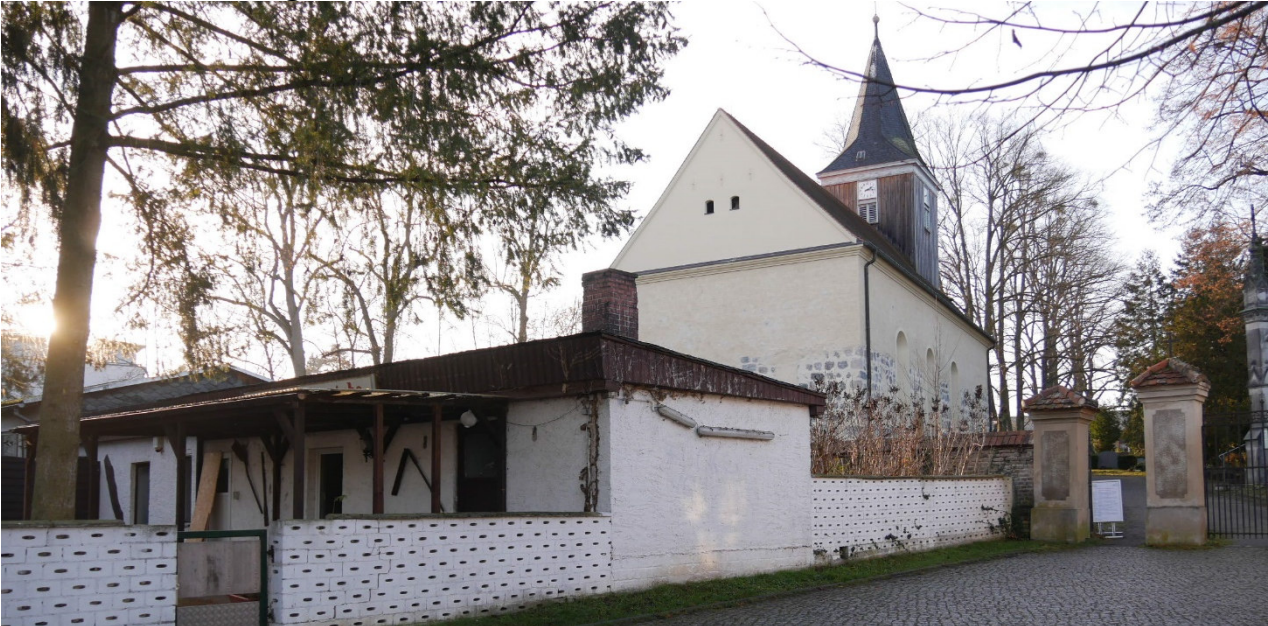
Die Abrissarbeiten dauern länger als erwartet – aber hier entsteht dann ein freier Platz mit Sicht auf die Kirche im historischen Dorfkern.

Doch leider wird es so schnell nicht gehen: Das Grünflächenamt hat mit einer Fachingenieurin die Bauten inspiziert, und dabei wurde festgestellt, dass die Abrissarbeiten erheblich aufwendiger und teurer sind als geplant. Die Arbeiten müssen auf jeden Fall von einer Privatfirma durchgeführt werden. Mitsamt der notwendigen Ausschreibung wird wohl ein Großteil dieses Jahres ins Land gehen, bis es den freien Platz und den freien Blick auf die Kirche geben wird.