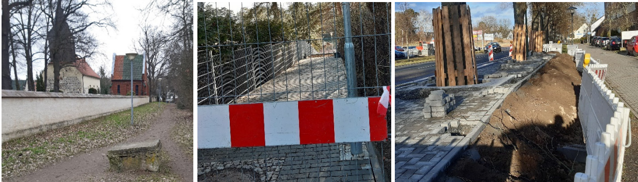
Links: Der Fußweg an der Friedhofsmauer hat Stolperfallen und wird instandgesetzt. Mitte: Der Verbindungsweg vom Anger zum Sportplatz nimmt Gestalt an. Die Bauarbeiten dauern aber noch einige Wochen. Rechts: Bushaltestelle Theodor-Fontane-Straße. Ein Problem ist die fehlende öffentliche Widmung des Gehwegs neben der Haltestelle.

Entlang der Pflasterstraße wäre eine Verbesserung für Fußgänger und Radfahrer wünschenswert: ein weiteres Fahrbahnhindernis zur Temporeduzierung und eine Spur für Fußgänger und Radfahrer. Dies bedeutet jedoch eine größere Investition. Um die zu erreichen, wird ein Ortsbeiratsbeschluss nötig sein.