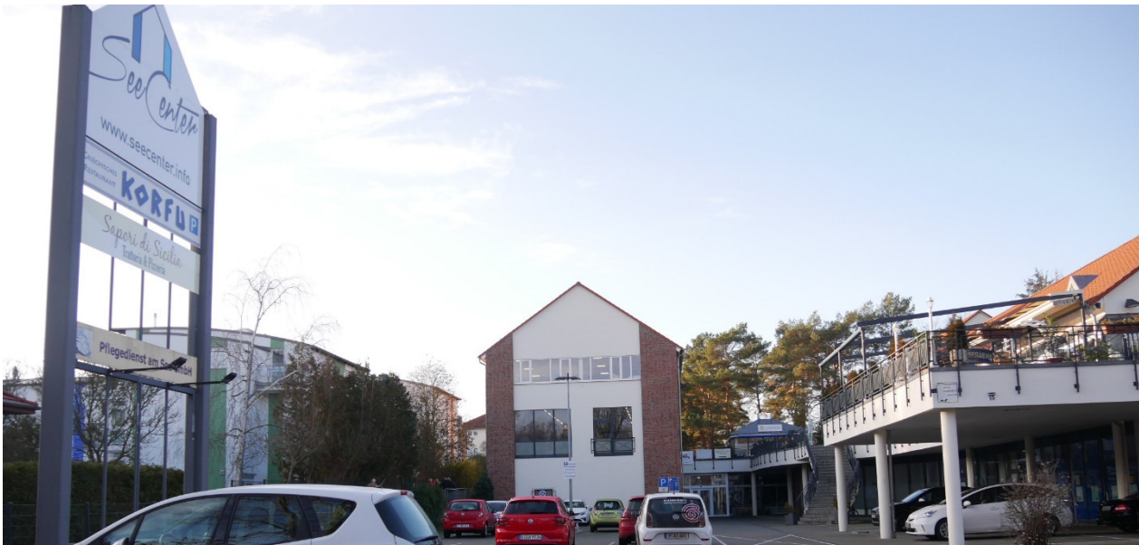
Das Seecenter ist kein Einkaufszentrum mehr, aber ein innerörtliches Dienstleistungszentrum

Aus der Prioritätenliste herausgenommen wurde die Überlegung, durch eine B-Plan-Änderung im Seecenter den Bau von Wohnhäusern zu ermöglichen. Das Seecenter war für die öffentliche Nahversorgung geplant worden und hat sich, nachdem die Einkaufsläden geschlossen haben, zu einem innerörtlichen Dienstleistungszentrum entwickelt. Dies soll weiterentwickelt werden.