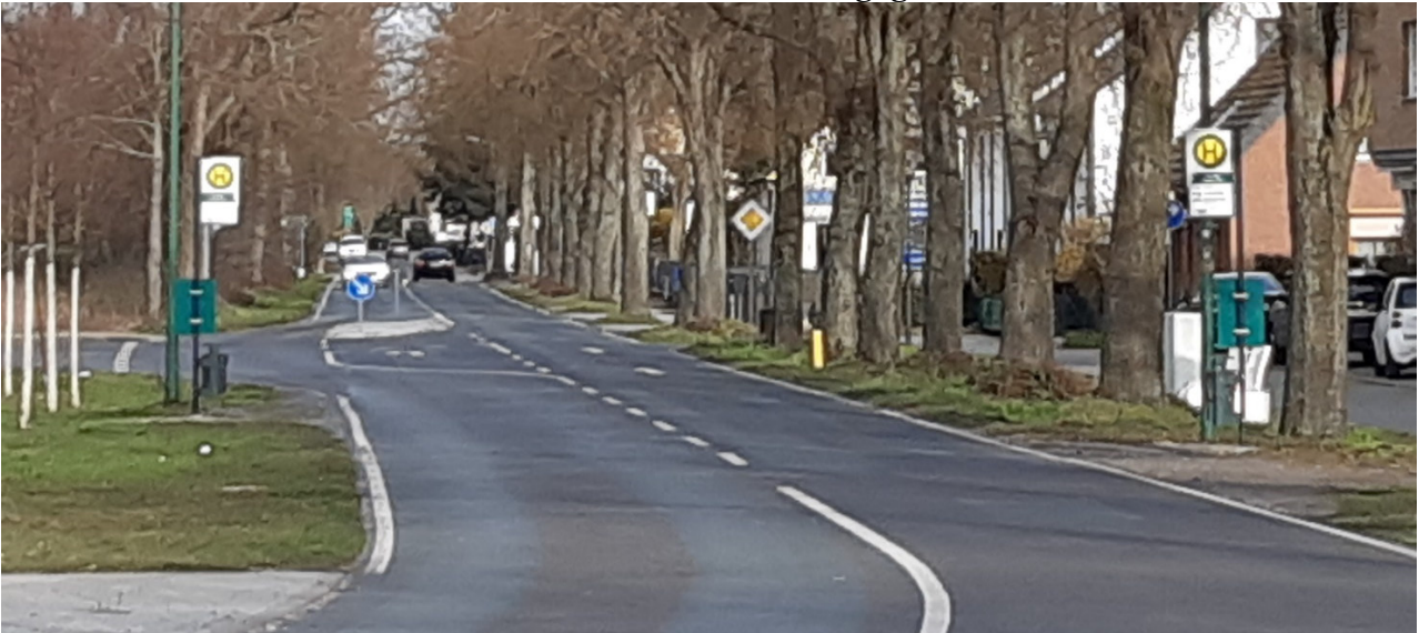
Ein Foto aus dem März 2020

Wer bisher in Höhe des Mühlenberg-Centers an der B 2 auf den Havelbus wartete, stand bei Wind und Wetter im Freien zwischen den Bäumen oder gegenüber auf der Wiese.