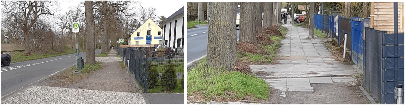
Zumutung für Fußgänger: die Gehwegsituation entlang der Potsdamer Chaussee

Das ist die Situation für Groß Glienicker Fußgänger an der B 2 im Jahr 2021, während für Autos nur im östlichen Teil Tempo 30 gilt. Der Fußweg soll ab Triftweg in diesem Jahr befestigt werden, das ist gut, aber es ändert nichts an der Misere: Was bisher gemacht worden ist, ist Stückwerk und Flickwerk. Es kann nicht sein, dass dies auf unbestimmte Zeit so weitergeht.