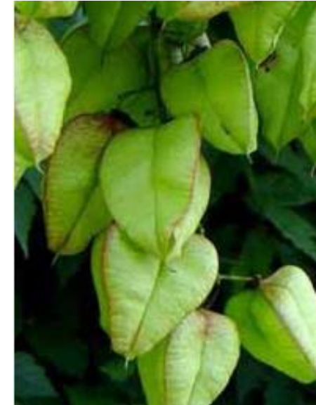
Koelreuteria paniculata - Blasenesche

Lustgarten, kleiner Platz zwischen Feuerwehrzufahrt und Rampe Mercure Baumbeet - Einfassung des Standortes durch Sitzmauern aus Sichtbetonfertigteilen