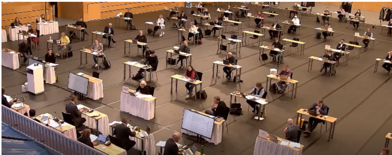
Die Stadtverordnetenversammlung: Ganz hinten sitzen die Ortsvorsteher und haben öfter das Gefühl, dass die Ortsbeiräte an den Rand gedrängt werden.