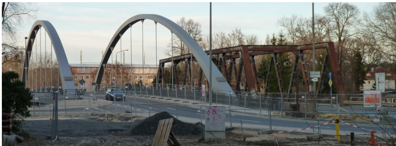
Der Weg nach Norden: Vor 10 Jahren wurde die Brücke nach Neu Fahrland neu gebaut. Beim Verhältnis der Stadt zu den „neuen“ Ortsteilen ist Brückenbau heute wichtiger denn je.