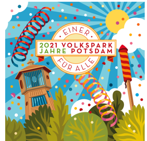
Titelseite der Jubiläumsausgabe des Programmheftes