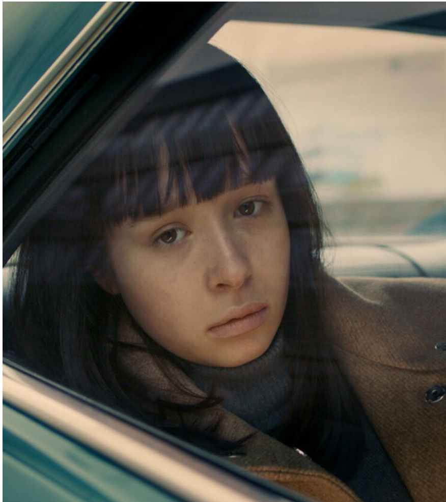
Still aus "The Ordinaries"