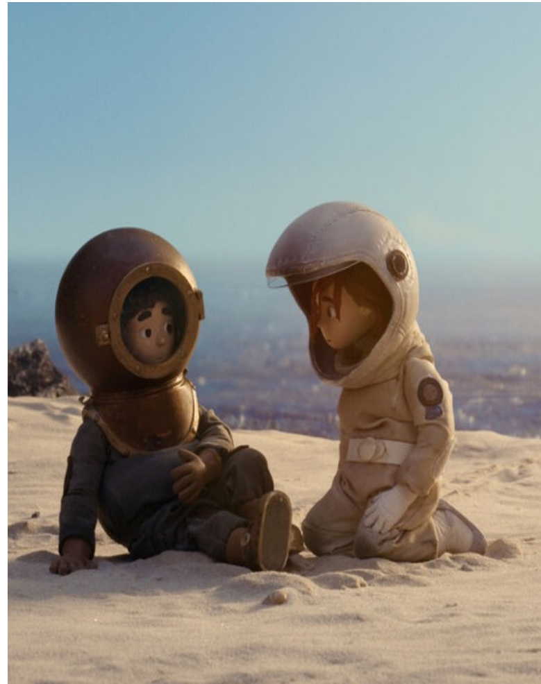
Filmstill: Laika & Nemo, © Vincent Engel, Georg Meyer