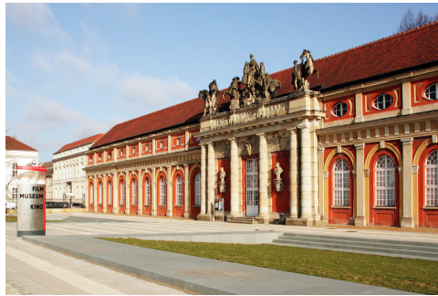
Filmmuseum Potsdam und neuer Sammlungsbau