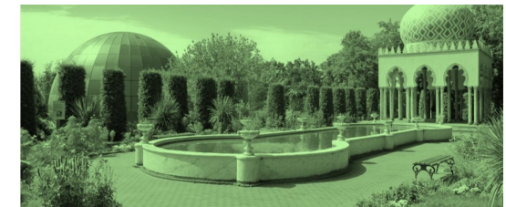
UNESCO Creative City of Film Potsdam