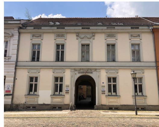
ZeM – BBg ZENTRUM FÜR MEDIENWISSENSCHAFTEN