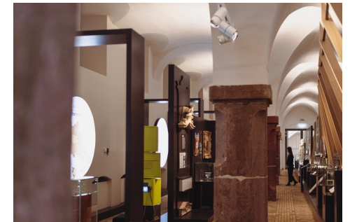
Brandenburg.Ausstellung im HBPG