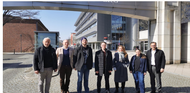
Startbüro der Filmuniversität