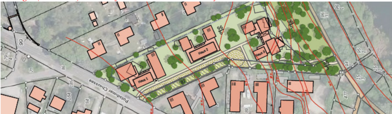
Die Pläne für die Senioren-Wohnanlage sieht man auf dem grün markierten Grundstück.

Nach dem augenblicklichen Stand sieht die Planung 3 hufeisenförmige Gebäude mit jeweils 3 Geschossen vor. Bis zu 50 Apartments sollen hier entstehen, für 75-85 Personen. Dazu kommen Ge-