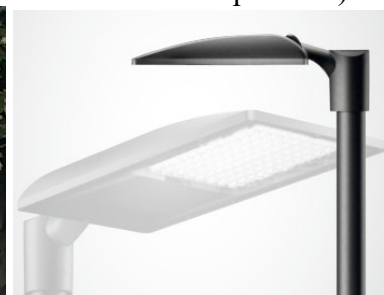
Die alten Straßenlaternen in der Sacrower Allee (links) sind Stromfresser, sie sollen noch in diesem Jahr gegen energiesparende Leuchten (rechts) ausgetauscht werden.