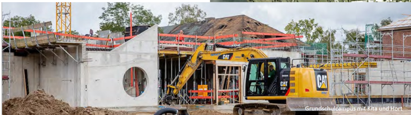
Grundschulcampus mit Kita und Hort