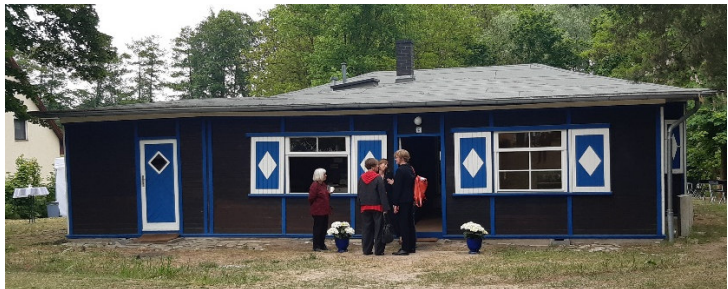
Das Alexander-Haus 2013 - und heute