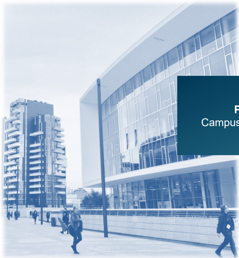
Portfolio A1 Campus Innenstadt bauen