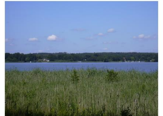
Aktivierende Maßnahmenstrategie für den Regionalpark Havelseen-Mittlere Havel

Download Maßnahmenstrategie: https://www.regionalpark-havelseen-mittlere-havel.de/