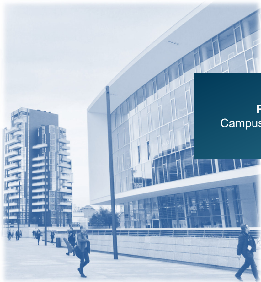
Portfolio A1 Campus Innenstadt bauen