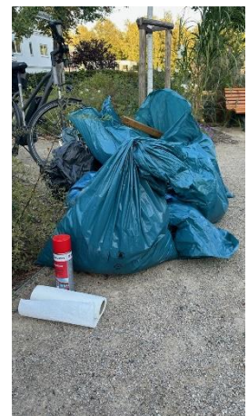
Etliche Bushaltestellen wurden gereinigt, Abschluss auf dem Wilhelm-Stintzing-Platz – Fotos Ekkehard von Pritzbuer