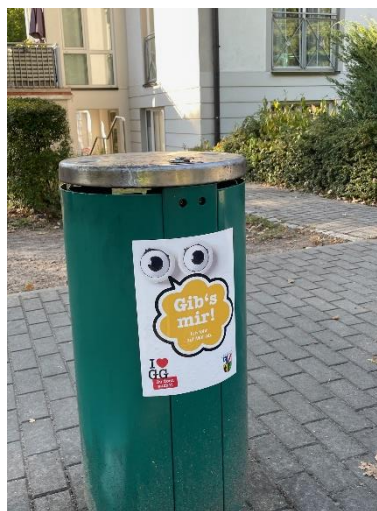
Zerschnittene Fußballtornetze, Müllaufkleber