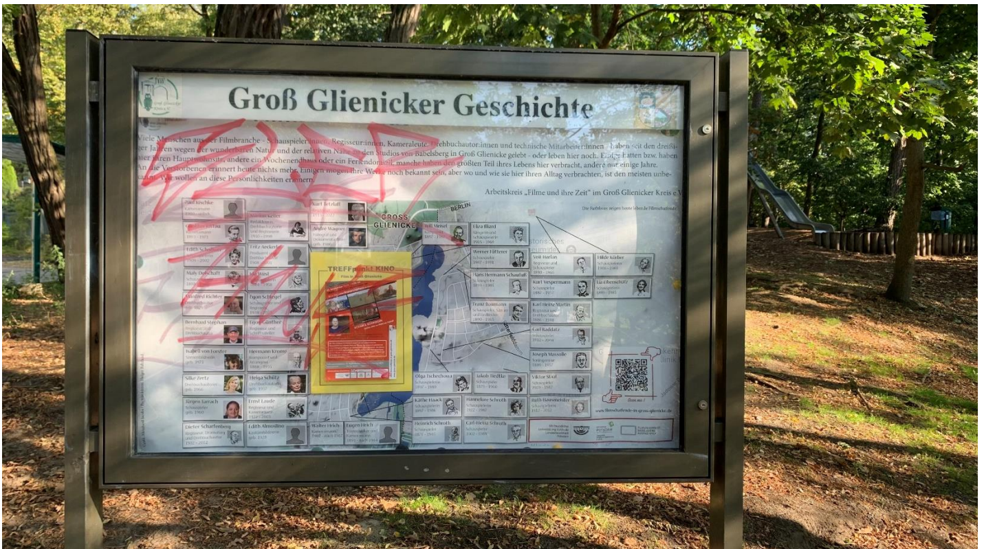
Auch nach unserer Aktion gingen die Schmierereien leider an vielen Stellen gleich wieder los

Mach mit in Groß Glienicke (Brandenburg) - World Cleanup Day - 20. Sep. 2025 - Die Welt räumt auf und Deutschland macht mit!