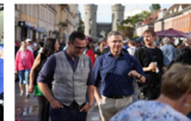
Dialog mit dem Oberbürgermeister