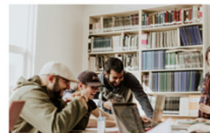
Kinder- und Jugendbeteiligung

Entdecken Sie alle laufenden und abgeschlossenen Beteiligungsverfahren. Verpassen Sie kein Thema mehr.